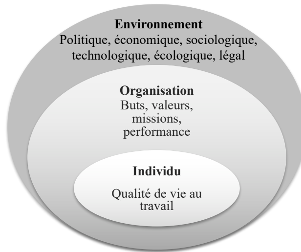
Figure 1. Approche systémique

soit les comportements ou les actions pertinents pour les objectifs d'une organisation et pouvant être mesurés en termes de compétence et de contribution aux objectifs (Campbell, 1999)- et la performance organisationnelle - définie comme la réalisation de résultats équivalents ou supérieurs aux objectifs fixés par l'organisation compte tenu des moyens mis en œuvre. Dans le cadre d'une approche systémique (voir la Figure 1), la QVT peut donc être appréhendée et analysée comme un point de rencontre et d'équilibre entre les besoins/caractéristiques de l'organisation (exprimés par ses dirigeants ou ses parties prenantes) et des individus la composant.